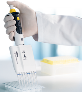
Toutes pipettes Transferpette multicannaux