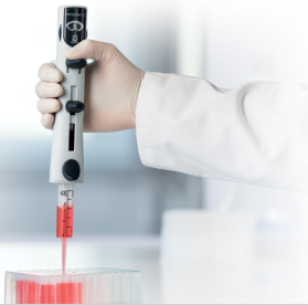
Embouts de distributeur PD-Tip II et distributeur à répétition Handystep S