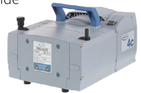
Pompe à vide VACUUBRAND