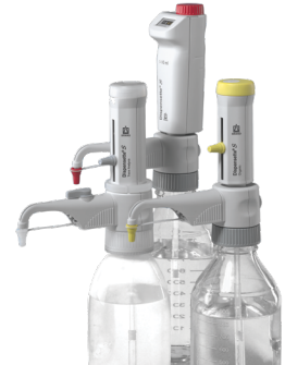
Dispensette® S distributeurs sur flacon