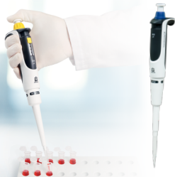
Transferpette® S monocal pipette

Achetez 3 BRAND® pipettes ou distributeurs et obtenez un 4eme gratuitement de valeur égale ou moindre.*