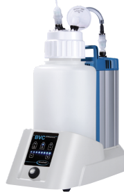
BVC système d'aspiration (Exclut les modèles de base)