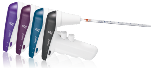
accu-jet® S contrôleur de pipette